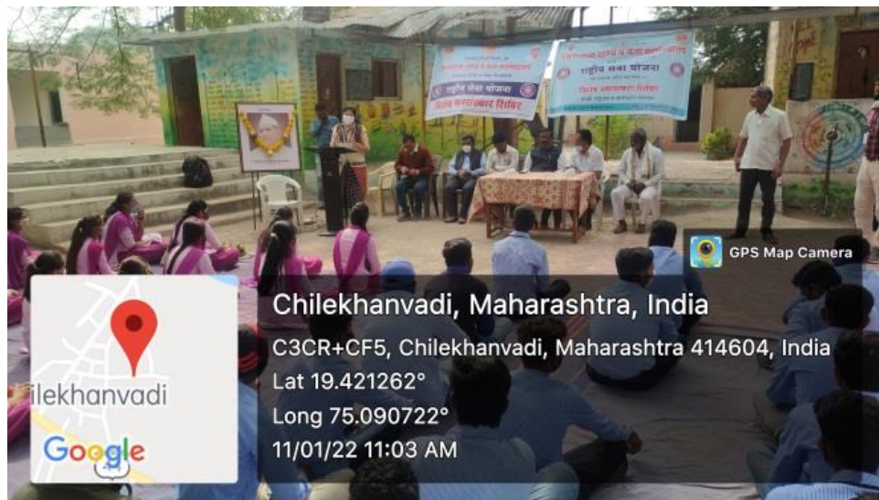
Voter Awareness Lecture at NSS Special Winter Camp