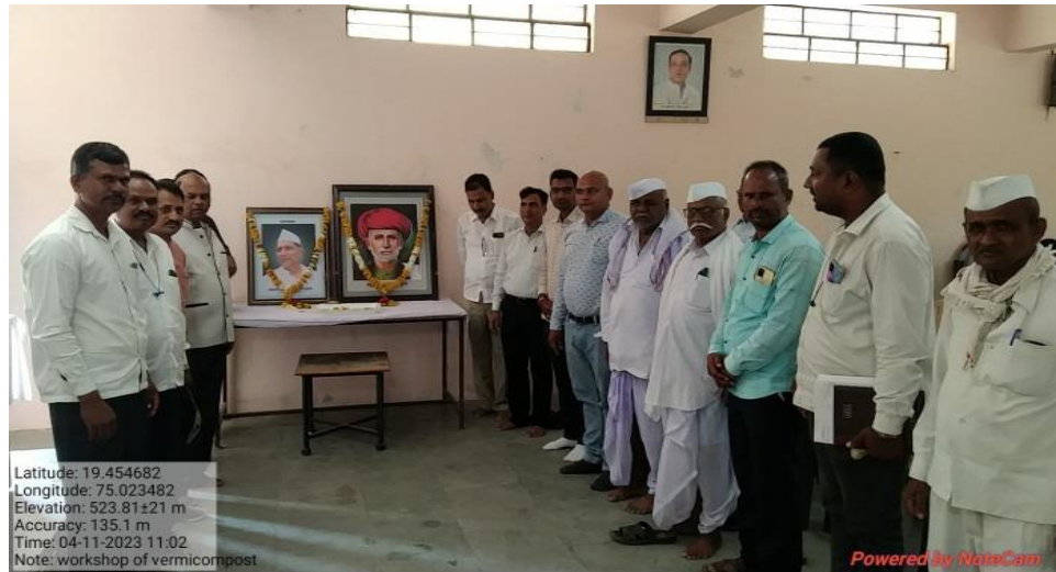
Teacher, Farmer and Students