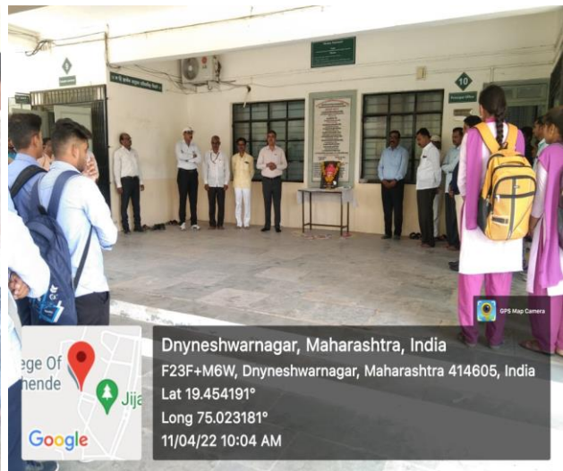
Mahatma Phule Birth Annivarsary