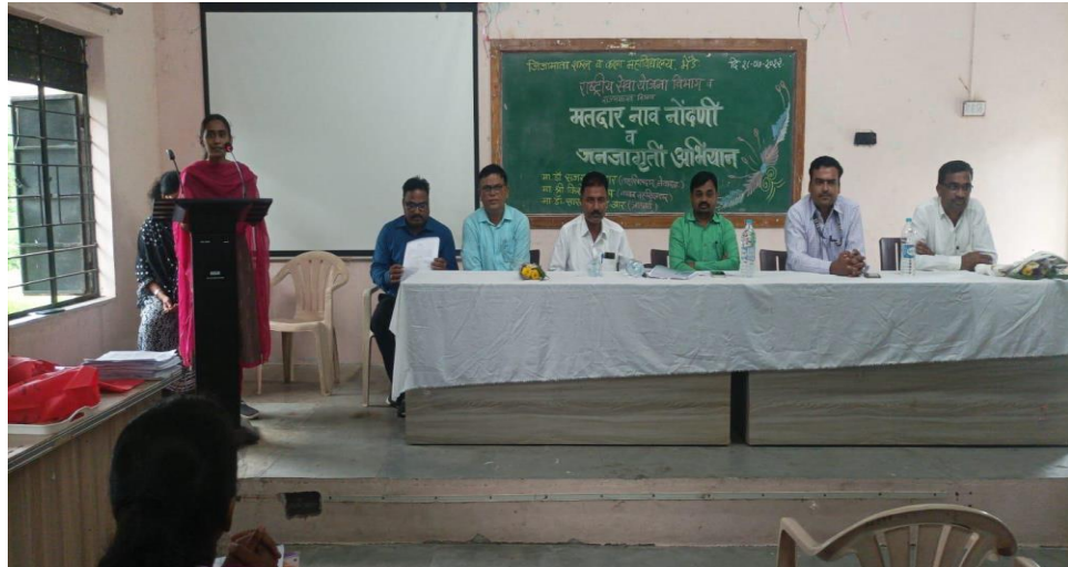
Voter Registration Awareness Programme