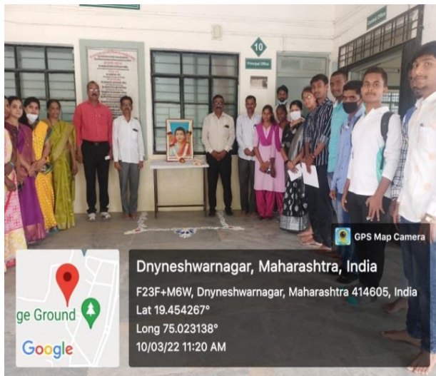
Savitribai Phule Birth Annivarsary