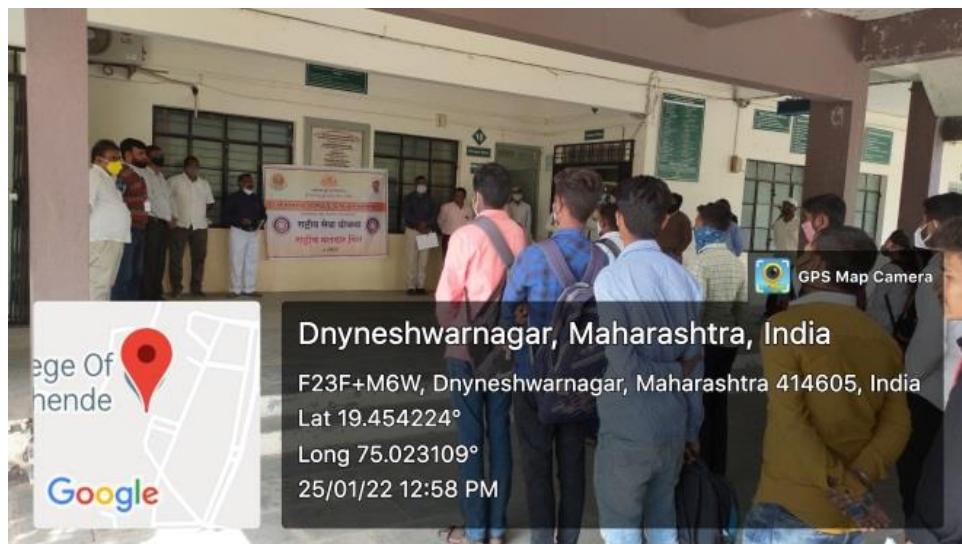
National Voters Day