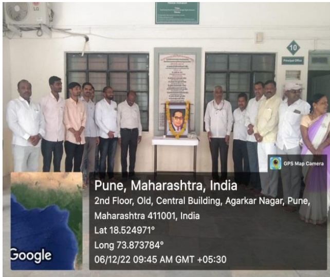
Dr. B. R. Ambedkar