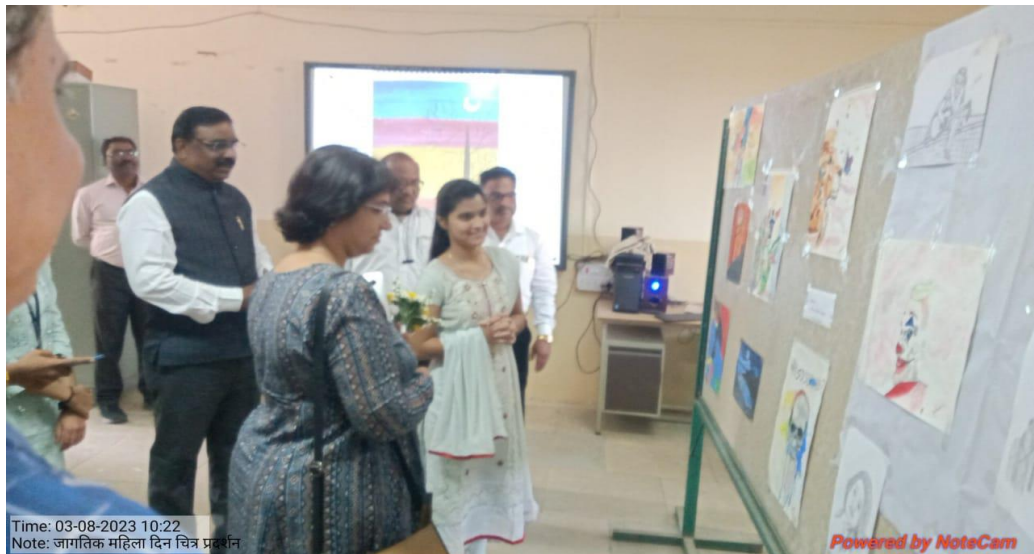
Women's Day Poster Presentation