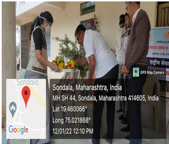
Swami Vivekanand Birth Annivarsary