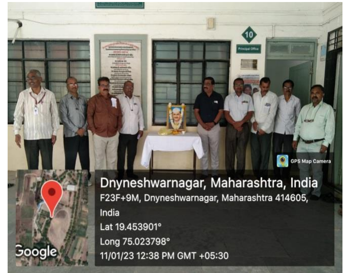
Lal Bahadur Shashtri