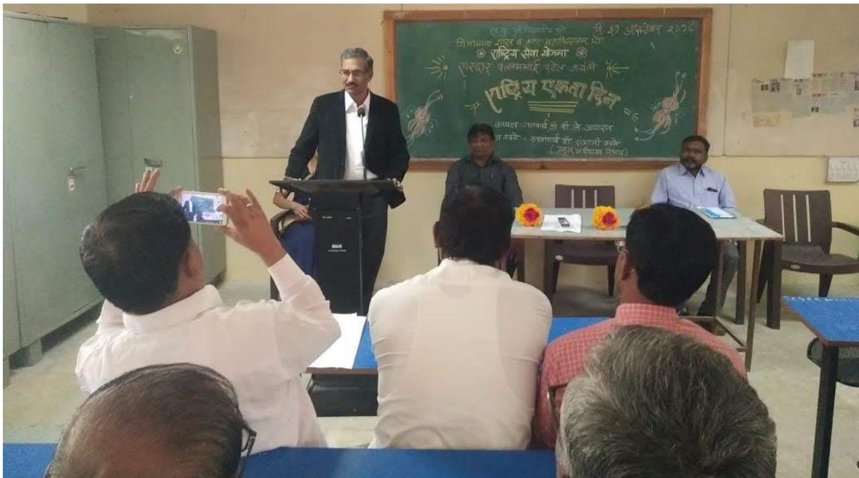
National Unity Day