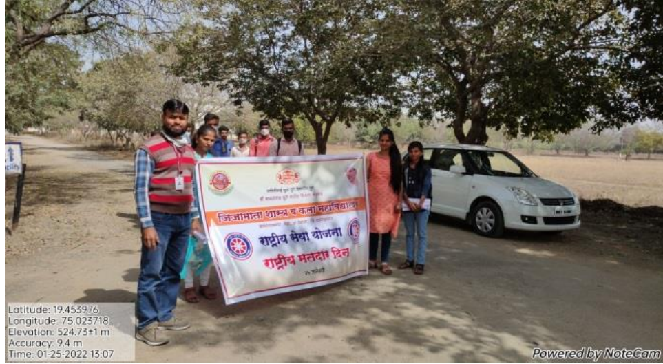
National Voters Day Rally